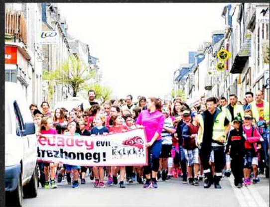
Redadegig à Rostrenen avec les écoles du Pays