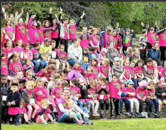
Redadegig avec Div Yezh Gourin et Div Yezh Langoned

Éléments à télécharger : https://www.ar-redadeg.bzh/fr/espace-ecoles/echauffement-avant-la-Redadeg