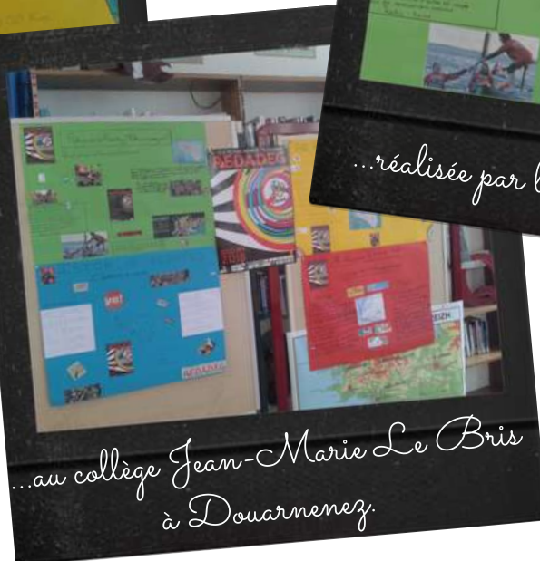
...au collège Jean-Marie Le Bris à Douarnenez.