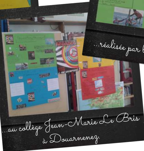
...au collège Jean-Marie Le Bris à Douarnenez.