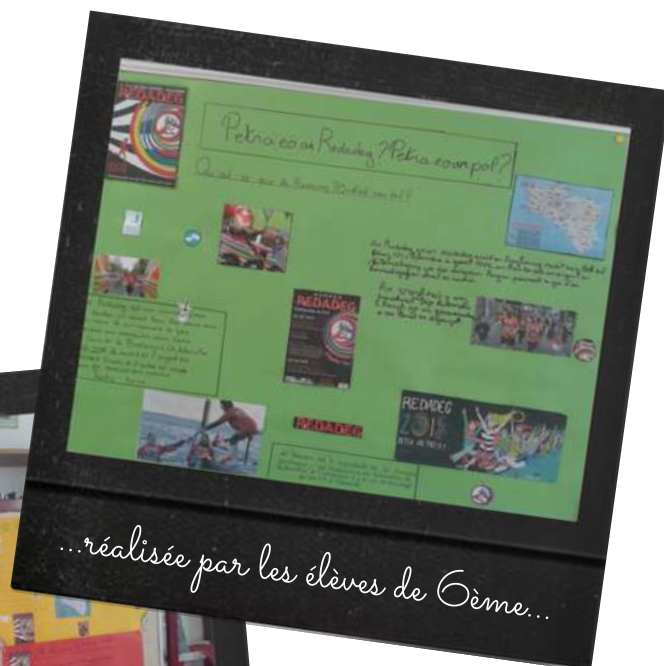
...réalisée par les élèves de 6ème...